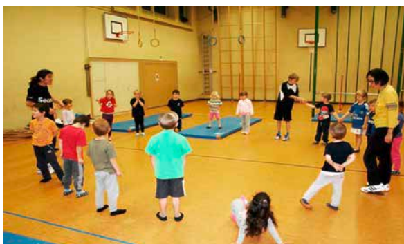
KITU klein – 1. Kindergarten