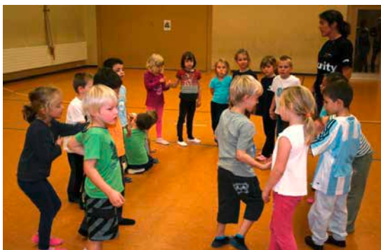
KITU gross – 2. Kindergarten