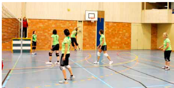
Die Volleyfrauen in Aktion...