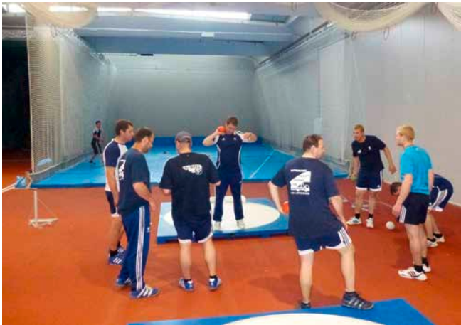
Indoor Trainingssession: Alles war da für ein gutes Training.

Jedoch entpuppte sich die ganze Marketingaktion von „Sonnenstube“, als ziemlicher Reifall. Im Gegensatz zum letzten Trainingsweekend, in welchem es lediglich am Freitag noch regnete, durfte sich jeder auf kühle und nasse Tage einstellen.