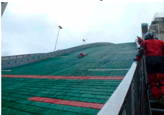
Waghalsig ging es am Sonntag in Einsiedeln zu und her

Der Höhepunkt des Tages war jedoch der Samstagabend. Und das nicht ohne Grund: Die ganze Entourage verschob sich nach Ascona. Man fand sich zum Apéro, danach ging es hinein in die Altstadt, in die Grotto Baldoria. Hier verwöhnte man uns mit einem sensationellen lokalen 7-Gang Menu.