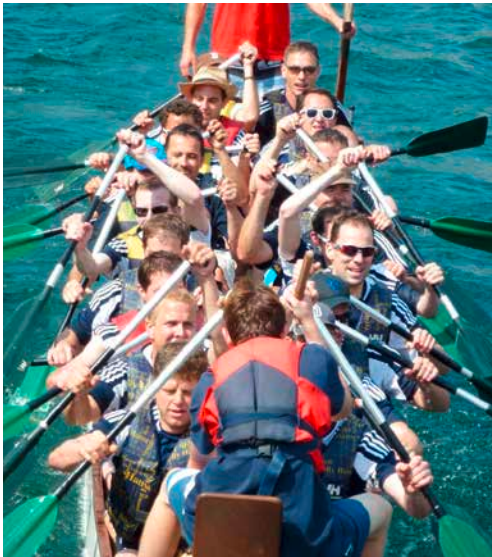
Zwanzig in einer Nusschale: Nach getaner Wettkampfarbeit, beim Zurückrudern zum Stea.

Das Zürichfäscht 2013, welches alle drei Jahre stattfindet, hatte wieder einmal ein vollgepacktes Rahmenprogramm zu bieten: von Flugshows, über Turmspringen bis zum Feuerwerk. Was man jedoch am Samstag und Sonntag, 6. und 7. Juli, zwischen der Rudolf-Brun-Brücke bei der Urania und der Bahnhofbrücke zu sehen bekam, sieht man nicht alle Tage in der Schweiz. Es wurde gepaddelt, nach Chinesischer Art. Drachenbootrennen auf der Limmat, über eine 400 Meter lange Wettkampfstrecke.