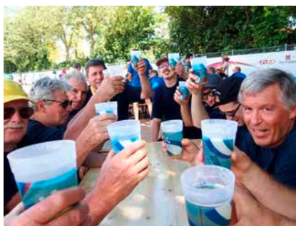
Gemütliche Runde am ETF 2013

Dies reichte, um sich in der Rangliste den 75. Platz von 123 gewerteten Vereinen zu sichern.