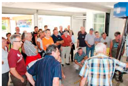
Der Melkroboter stiess auf grosses Interesse

Auf besonderes Interesse stiess aber die Führung durch den Oekonomieteil. Insbesondere die Vorführung der neuen Melkanlage auf dem Lindenhof hat verblüfft.