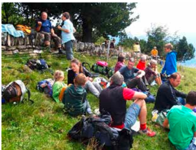
Unterwegs Mittagessen aus dem Rucksack

(Bergbeiz, 1700 m) - weiter als Höhenwanderung über Strahlrüfi (noch eine Beiz) bis zum Kurhaus Sennis-Alp (1400 m).