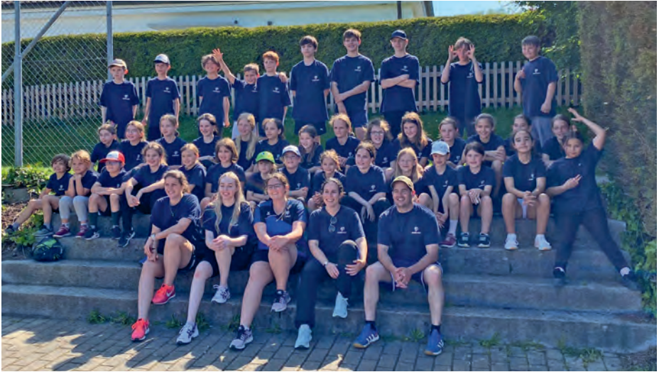
Gruppenbild mit allen TeilnehmerInnen und den BetreuerInnen

Nach langer Covidpause konnte der Jugendsporttag dieses Jahr endlich wieder stattfinden!