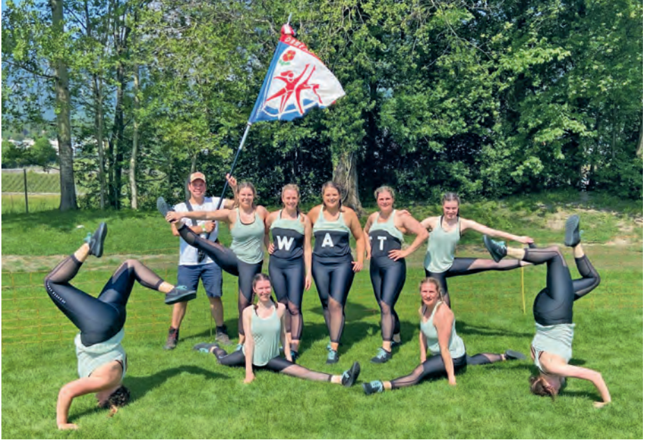
Stolz nach dem Wettkampf