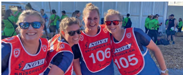
Frauen in bester Laune