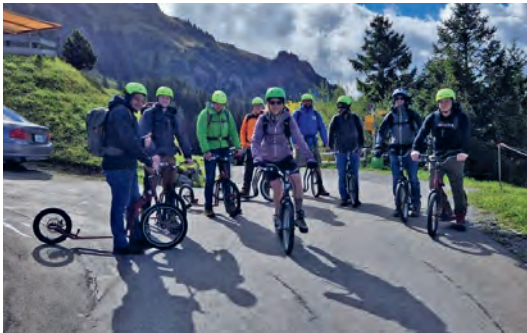
Startklar für die Trottifahrt

Je näher man dem Gipfel des Hohen Kastens kam, umso schlechter wurden die Wetterverhältnisse. Gegen den Schluss sah man kaum die Hand vor den Augen. Oben angekommen erwarteten uns schon die anderen zwei. Nach einem Bier und einem feinen Plättli machten wir uns auf den Weg zum Plattenbödli. Ein schönes Berggasthaus, in welchem wir übernachten durften. Wir konnten einen lustigen und geselligen Abend geniessen, bei dem sicher niemand verdurstet ist.