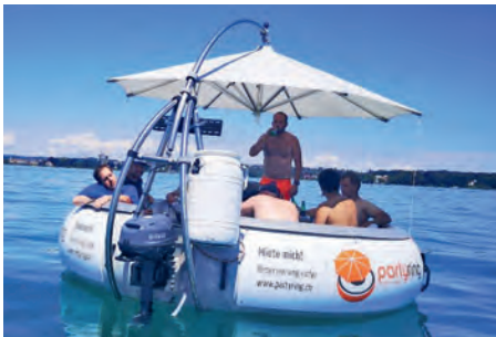
Gemütliche Fahrt auf dem Bodensee

Auf dem Zeltplatz war der TV-Wagen nicht zu übersehen und die Musikanlage nicht zu überhören. Der Riesengrill wurde eingeeheizt und auf den erfolgreichen Wettkampf angestossen. Einige Turner erfrischten sich im (doch nicht so nahen) Fluss, bevor es auf die Festmeile ging. Das Turnfest Balgach überzeugte mit einem kompakten Fest, an welchem es an nichts mangelte. Jedoch verloren sich die Watter Turner permanent, da der sonst von weither gut sichtbare Gomoli fehlte.