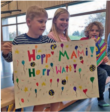
Der Kinderfanclub von Volley Watt 1