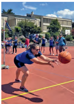
Salome Gauch de hüsch no