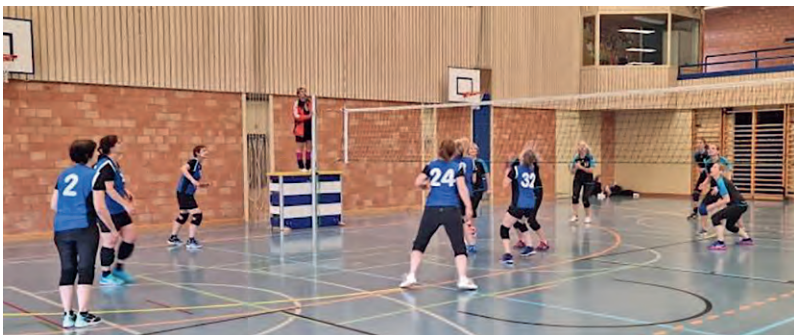
Volley Watt 2 im Spiel gegen Volley Thalwil