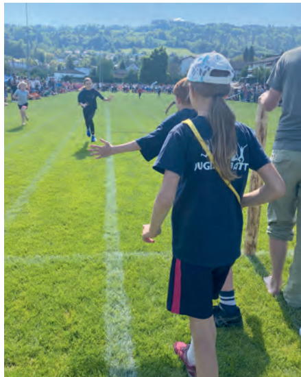
Die JUWA 2 Mädchen mitten im Linienball