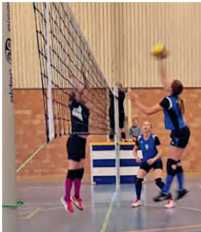
Volley Watt 1 im Angriff gegen die DR Urdorf

Volley Watt 2 konnte leider keinen Satzgewinn verbuchen, obwohl sie sich von Spiel zu Spiel steigern konnten. Wenn sie als Mannschaft regelmässig komplett trainieren könnten und von Ausfällen durch Verletzungen verschont bleiben, liegt in der Rückrunde sicher noch der eine oder andere Satzgewinn drin.