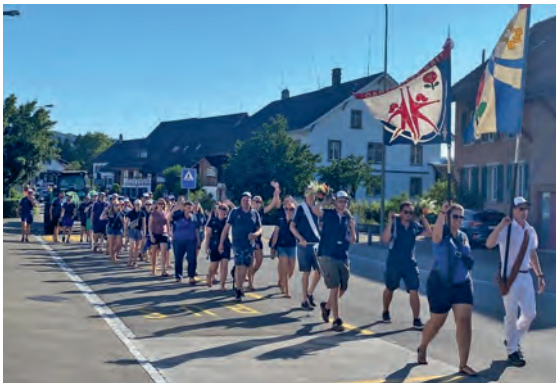
Einzug in Watt

Nach unfallfreiem Abschluss des Wettkampfs war nun endlich Zeit das Nachtlager aufzubauen. Am Nachmittag wurde ausgeruht, gelacht und gefeiert. Abends gab es ein feines Nachtessen und zum Dessert ein, zwei Bier. In der Nacht wurde bis zum Morgengrauen gefestet.