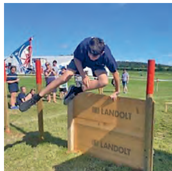
Unsere beste Disziplin dabei: der Hindernisparcours!