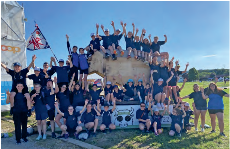
Ein Gruppenbild nur mit strahlenden Gesichtern!