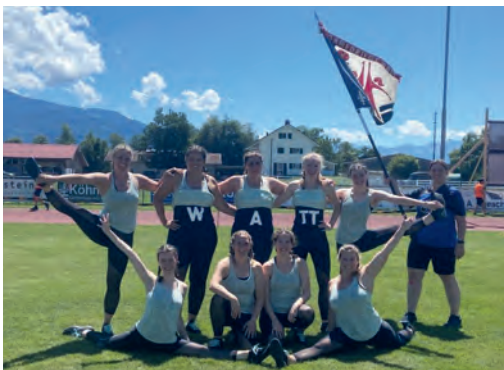
Team Aerobic nach dem Wettkampf