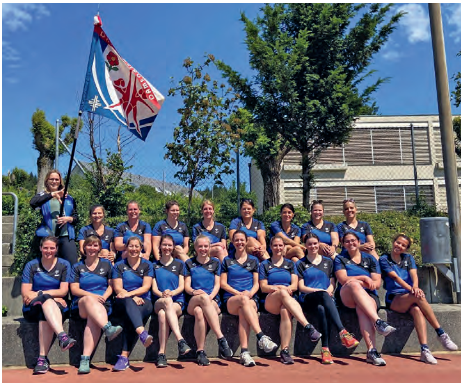
Gnüsse i de Sunne nach em Wettkampf