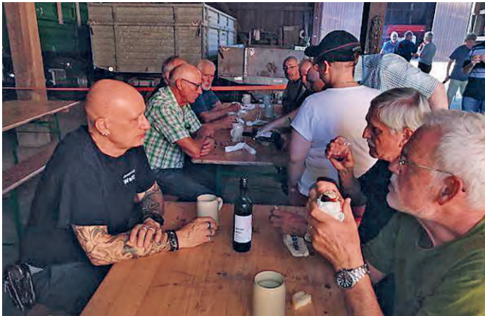
...und dann ein feines Watter Würstchen!