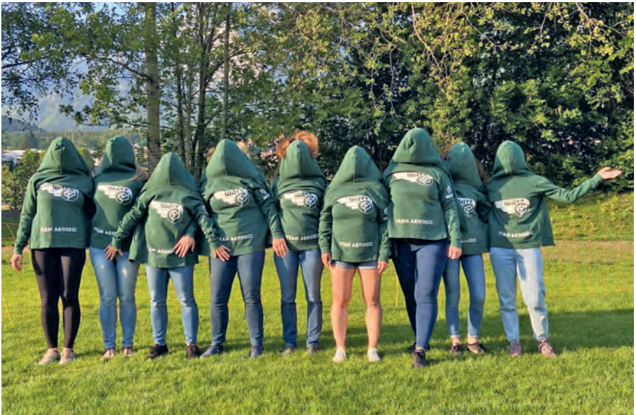
Übernächtigt am nächsten Morgen