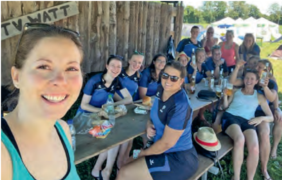
Feucht und fröhlich ging es zu und her

Am Sonntag-Morgen kroch eine nach der anderen aus den Löchern. Zum Frühstück gab es Kaffi und Gipfeli. Die Zelte wurden zusammengeräumt, alle Taschen gepackt, danach ging es Richtung Car. Die Rückreise führte uns an den schönen Bodensee, dort assen wir zu Mittag. Nach Lust und Laune konnte man sich im See abkühlen oder einfach auf der Wiese sünnele.