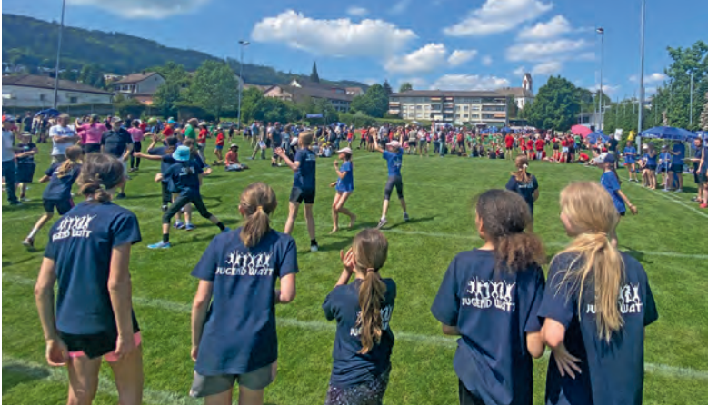
Die JUWA 2 Mädchen mitten im Linienball