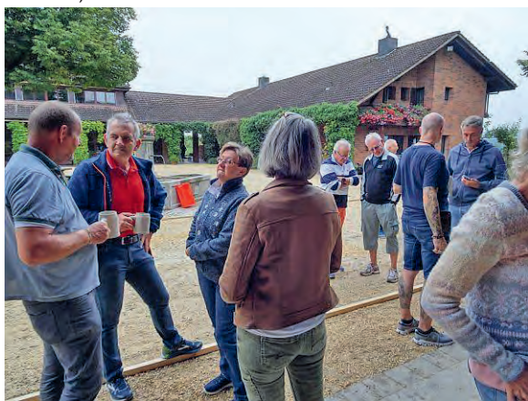
Der lockere Einstieg...

Nun war der Blutzuckerspiegel am Maximum, aber dennoch schleppten sich die (bedauernswerten?) Halbfinalisten wieder auf die Bahnen. Der Schreiber dieser Zeilen fand sich dann