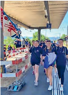
Ankunft in Wiesendangen

Da es sehr heiss war, wurde dafür ein geeigneter Schattenplatz ausgewählt: der Veloparkplatz.