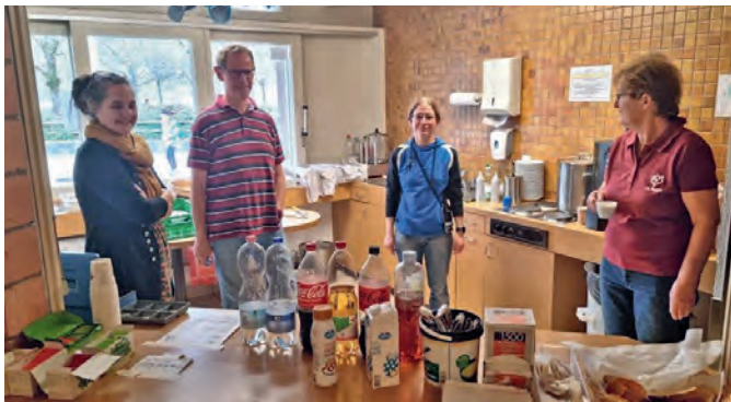
Die Küchencrew bei einer kurzen Pause