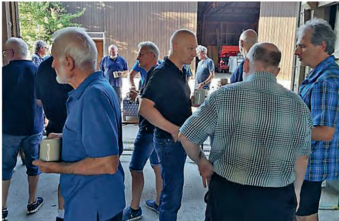
Erst den Durst gelöscht...