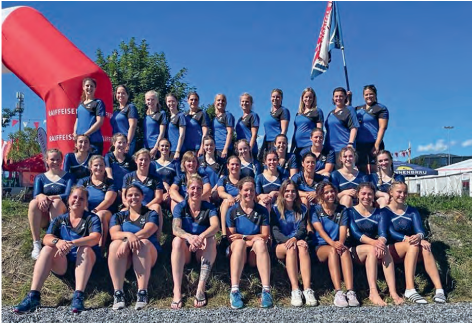
In Reih und Glied

Die nächsten Disziplinen waren Steinstossen und Schleuderball. Für die meisten war dann der Wettkampf schon zu Ende. Am Nachmittag war das Team Aerobic noch an der Reihe. Trotz heissem Wetter hiess es nochmals alles geben. Die anderen haben uns lautstark angefeuert. Als die Musik verklang, waren alle nudelfertig.