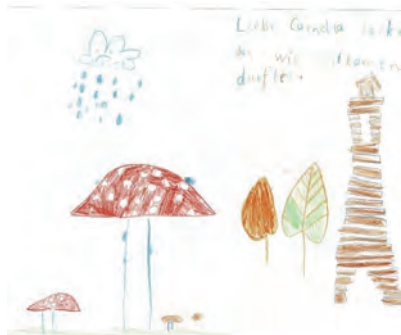
Zeichnung von Ilana Andres

Zum Glück verschonte uns der Regen auf unserer kleinen Wanderung zum neuen, attraktiven Aussichtsturm im Hardwald. Und tatsächlich lichtet sich der Himmel als wir auf dem Turm waren und so konnten wir die Aussicht für einen kurzen Moment geniessen. Weiter führte uns der Weg durch einen märchenhaften Wald mit unzähligen Pilzen nach Opfikon.