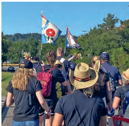
Einzug in Balgach

Am sehr frühen Morgen, um 05:35 Uhr, hat sich die DR Watt am Samstag, 25. Juni 2022 auf dem Dorfplatz versammelt. Noch im Halbschlaf stiegen wir in den Car ein, welcher uns nach Balgach fuhr. Nach zwei Stunden Carfahrt kamen wir beim Wettkampfgelände an.