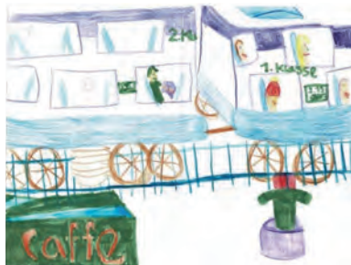
Zeichnung von Tiara Andres

Unser erstes Ziel war das Hofkaffee Heiniger in Dietlikon. Mmmmh, wie gut es hier duftete nach gebackenem Brot und Zöpfen. Das Highlight waren die Schoggibrötli, welche nach unserem Besuch komplett ausverkauft waren.