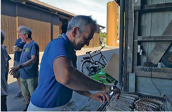
...warten auf den Grillmeister...