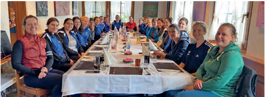
Zusammen beim Mittagessen