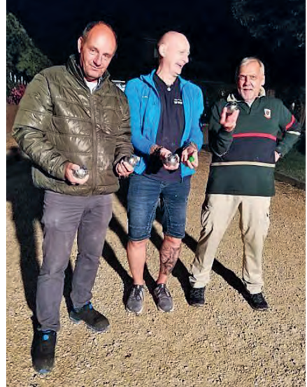
...und hier die strahlenden Sieger